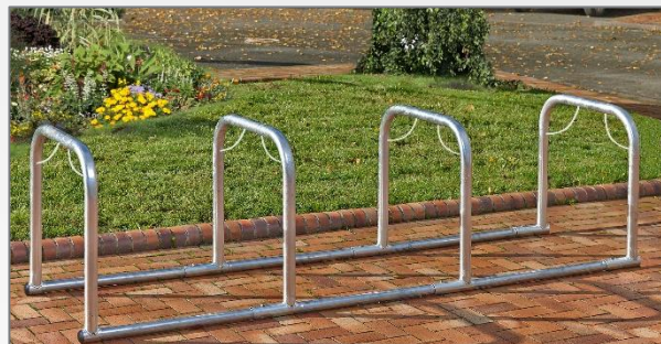
1 x B882C3 + 1 x B882SSUI Um 8 Fahrräder aufzubewahren