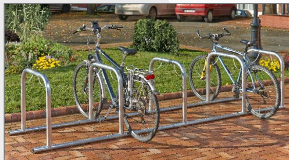
1 x B882C3 + 2 x B882SSUI Um 10 Fahrräder aufzubewahren