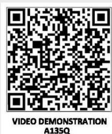
VIDEO DEMONSTRATION A135Q

Référence : A135Q Gencod : 3234640062440