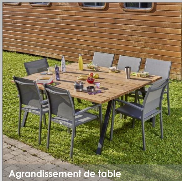
Agrandissement de table