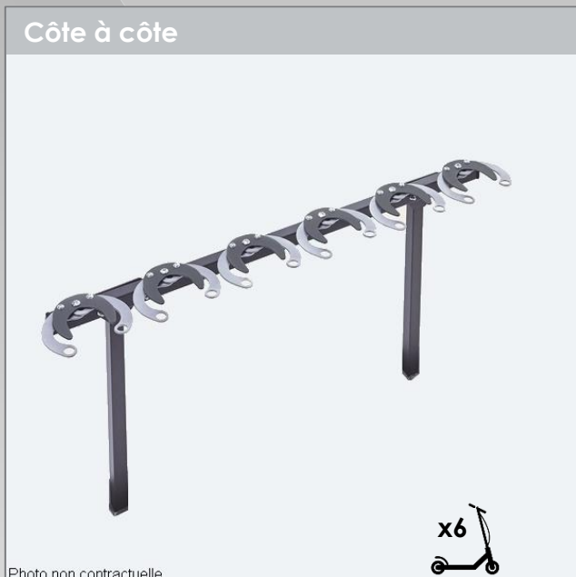
Côte à côte