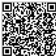
VIDEO DEMONSTRATION A135Q