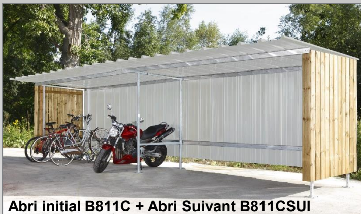
Abri initial B811C + Abri Suivant B811CSUI