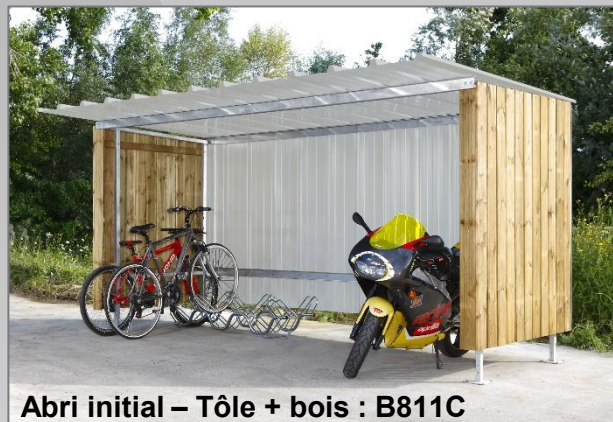
Abri initial – Tôle + bois : B811C